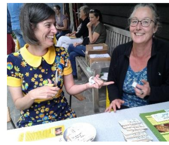
09-07-2016 open imkerij dagen